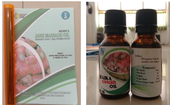
Gambar: luaran kegiatan pengmas berupa modul dan produk jahe massage oil