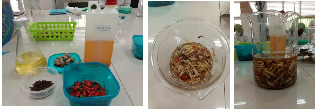
Gambar : Bahan pembuatan jahe massage oil