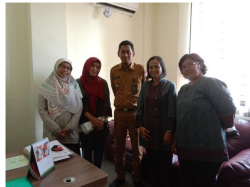
Gambar : Pengurusan Ijin di Kelurahan Sambung Jawa Kecamatan Mamajang