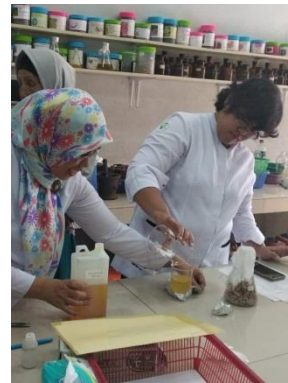
Gambar : Pengmas Tahap 2 alih teknologi (pelatihan) pembuatan massage oil berbahan dasar jahe