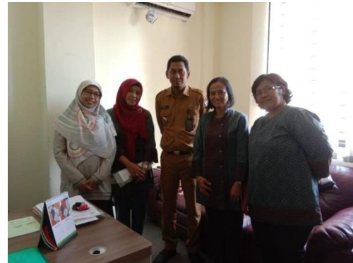
Gambar : Pengurusan Ijin di Kelurahan Sambung Jawa Kecamatan Mamajang